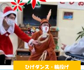
ひげダンス・輪投げ