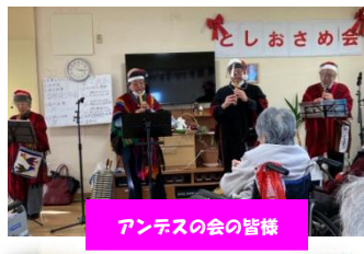
アンデスの会の皆様