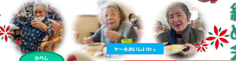
ケーキおいしいわっ