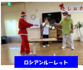
ロシアンルーレット