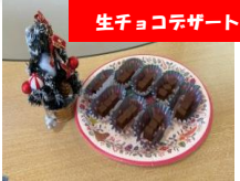
生チョコデザート